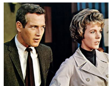
1966 LE RIDEAU DÉCHIRÉ (Tom Curtain) d'Alfred Hitchcock avec Julie Andrews