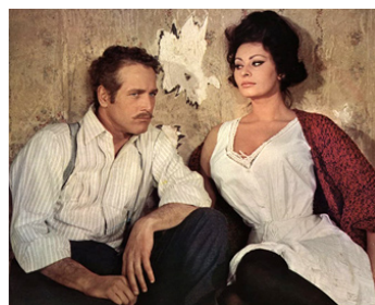
1965 LADY L. (Lady L.) de Peter Ustinov avec Sophia Loren