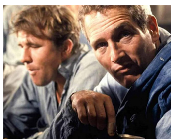
1967 LUKE LA MAIN FROIDE (Cool Hand Luke) de Stuart Rosenberg avec James Gammon