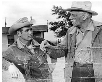
1962 LE PLUS SAUVAGE D'ENTRE TOUS (Hud) de Martin Ritt avec Melvyn Douglas