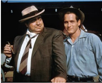
1957 LES FEUX DE L'ÉTÉ (The long hot summer) de Martin Ritt avec Orson Welles