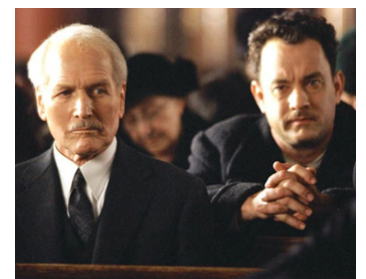
2001 LES SENTIERS DE LA PERDITION (Road to Perdition) de Sam Mendes avec Tom Hanks