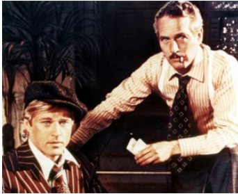
1973 L'ARNAQUE (The Sting) de George Roy Hill avec Robert Redford