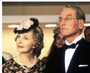
1990 M. ET MME BRIDGES (Mr & Mrs Bridges) de James Ivory avec Joanne Woodward