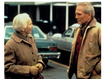
1994 UN HOMME PRESQUE PARFAIT (Nobody's Fool) de Robert Benton avec Jessica Tandy