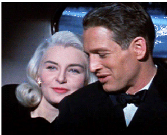
1959 DU HAUT DE LA TERRASSE (From the Terrace) de M. Robson avec Joanne Woodward