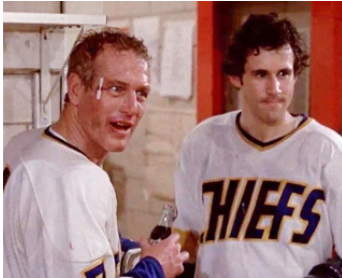
1977 LA CASTAGNE (Slap Shot) de George Roy Hill avec Michael Ontkean