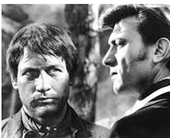
1964 L'OUTRAGE (The Outrage) de Martin Ritt avec Laurence Harvey