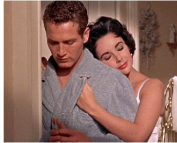
1958 LA CHATTE SUR UN TOIT BRÛLANT (Cat on a hot tin roof) de R. Brooks avec E. Taylor