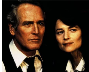
1982 LE VERDICT (The Verdict) de Sidney Lumet avec Charlotte Rampling