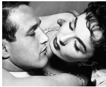
1956 POUR ELLE UN SEUL HOMME (The Helen Morgan Story) de M. Curtiz avec Ann Blyth