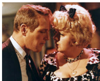
1965 DÉTECTIVE PRIVÉ (Harper) de Jack Smight avec Shelley Winters