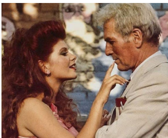
1989 BLAZE (Blaze) de Ron Shelton avec Lolita Davidovich