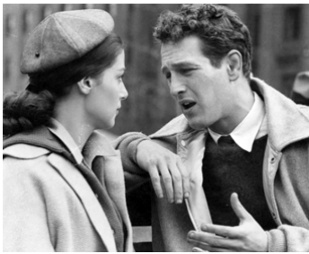
1956 MARQUÉ PAR LA HAINE (Somebody up there likes me) de Robert Wise avec Pier Angeli