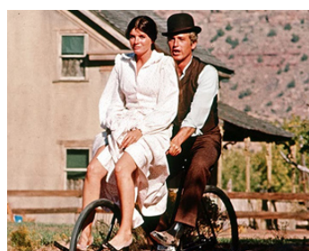
1968 BUTH CASSIDY ET LE KID (Butch Cassidy and Sundance Kid) de G. R. Hill avec Katherine Ross