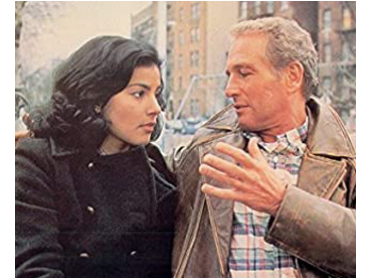
1980 LE POLICEMAN (Fort Apache, the Bronx) de Daniel Petrie avec Rachel Ticotin