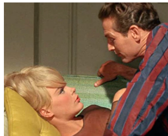
1963 PAS DE LAURIERS POUR LES TUEURS (The Prize) de Mark Robson avec Elke Sommer