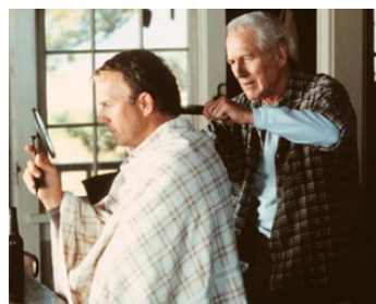
1998 UNE BOUTEILLE À LA MER (Message in a Bottle) de Luis Mandoki avec Kevin Costner