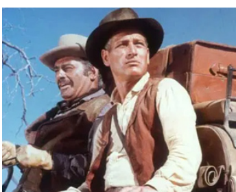
1966 HOMBRE (Hombre) de Martin Ritt avec Martin Balsam