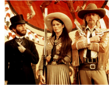
1976 BUFFALO BILL ET LES INDIENS (Buffalo Bill & the Indians) de R. Altman avec J. Grey, G. Chaplin