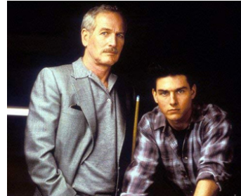
1986 LA COULEUR DE L'ARGENT (The Color of Money) de Martin Scorsese avec Tom Cruise