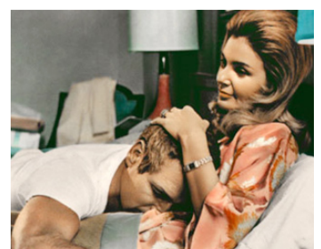
1969 VIRAGES (Winning) de James Goldstone avec Joanne Woodward