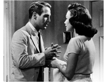
1959 CE MONDE À PART (The young Philadelphians) de Vincent Sherman avec Barbara Rush