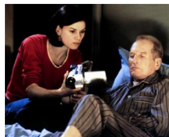
1999 EN TOUTE COMPLICITÉ (Where the money is) de Marek Kanievski avec Linda Fiorentino