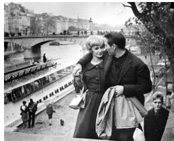
1960 PARIS BLUES (Paris Blues) de Martin Ritt avec Joanne Woodward