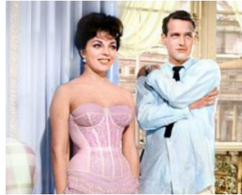
1958 LA BRUNE BRÛLANTE (Rally' round the flag, boys !) de Leo McCarey avec Joan Collins