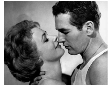
1961 L'ARNAQUEUR (The Hustler) de Robert Rossen avec Piper Laurie