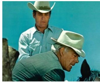
1971 LES INDÉSIRABLES (Pocket Money) de Stuart Rosenberg avec Lee Marvin