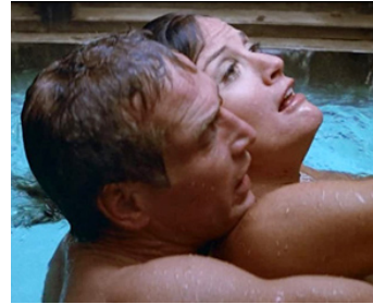
1975 LA TOILE D'ARAIGNÉE (The Drawing Pool) de Stuart Rosenberg avec Gail Strickland