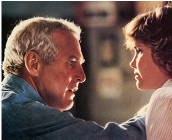
1981 ABSENCE DE MALICE (Absence of Malice) de Sydney Pollack avec Sally Field