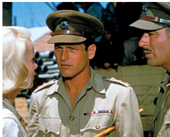
1960 EXODUS (Exodus) d'Otto Preminger avec Eva Marie Saint, Peter Lawford