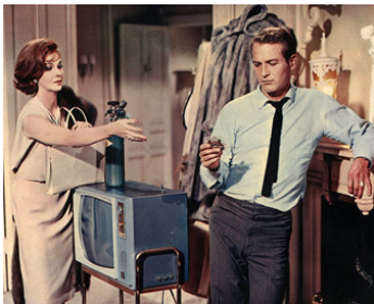
1962 DOUX OISEAU DE JEUNESSE (Sweet Bird of Youth) de Richard Brooks avec Geraldine Page