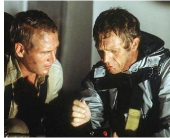
1974 LA TOUR INFERNALE (The towering Inferno) de John Guillermin avec Steve McQueen