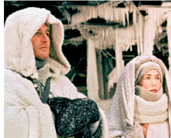
1978 QUINTET (Quintet) de Robert Altman avec Brigitte Fossey