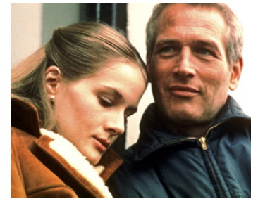
1973 LE PIÈGE (The Mackintosh Man) de John Huston avec Dominique Sanda