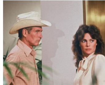
1979 LE JOUR DE LA FIN DU MONDE (When Time ran out) de J. Goldstone avec Jacqueline Bisset