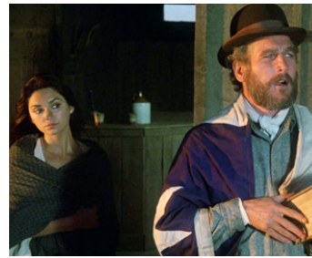
1971 JUGE ET HORS-LA-LOI (The Judge Roy Bean) de John Huston avec Victoria Principal