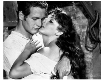
1957 LE GAUCHER (The left-handed Gun) d'Arthur Penn avec Lila Milan