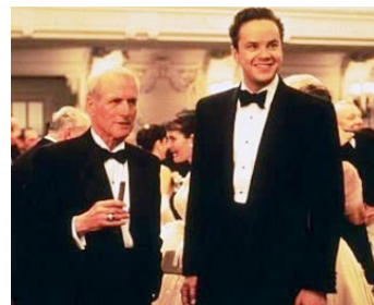
1993 LE GRAND SAUT (The Hudsucker Proxy) de Joel Coen avec Tim Robbins