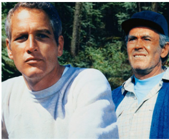
1970 LE CLAN DES IRRÉDUCTIBLES (Sometimes a great notion) de P. Newman avec Henry Fonda