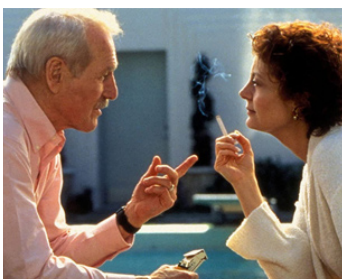
1997 L'HEURE MAGIQUE (Twilight) de Robert Benton avec Susan Sarandon